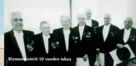
Riemumäisterit 50 vuoden takaa