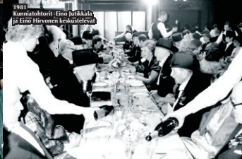
1981 Kunniahohtori Eino Jutikkala ja Eino Hirvonen keskustelevat