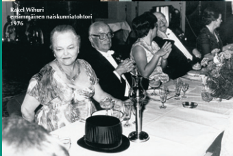
Rakel Wihuri ensimmäinen naiskunniahohtori 1976