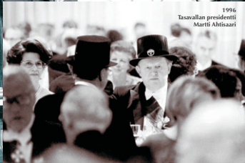
1996 Tasavallan presidentti Martti Ahtisaari