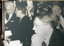
Juhlaillalliset: kunniaohrtori presidentti Tarja Halonen