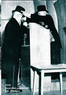
1950 Tasavallan presidentti J. K. Paasikivi