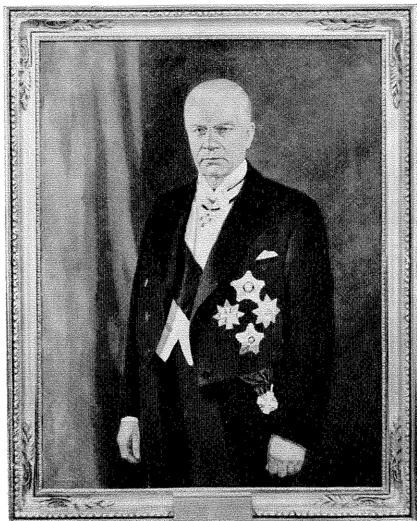
ANTTI AGATON TULENHEIMO