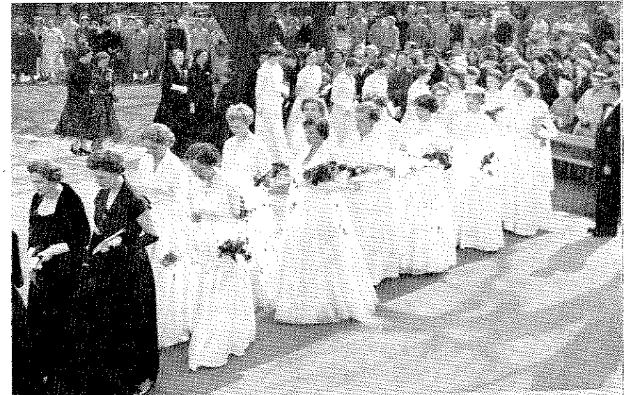
Vihittyjen maisterien naiset tulossa Vanhaan kirkkoon.

Ekonomian tutkinnon pohjalta opintojanne jatkaen olette suorittaneet opinnäytteet, jotka ovat vaatineet Teiltä perehtymistä aineittenne alaan kuuluvaan tieteelliseen kirjallisuuteen ja harjoittautumista asioiden ja eri mielipiteiden kriittiseen tarkasteluun ja omakohtaiseen tutkimiseen. Koska Te olette selviytyneet tutkinnoista, jotka oikeuttavat Teidät maisterinarvoon, niin perinteellisin akateemisin muotoin vihin Teidät kauppatieteiden maistereiksi ja annan Teille tähän arvoon liittyvät merkit: sormuksen, ikuisuuden ja uskollisuuden symbolin, ja diplomin, jossa Teidän uusi arvonne kirjalli-