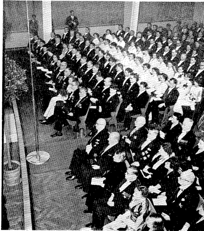
Juhlayleisöä korkeakoulun promootiossa. Eturivissä oikealta lukien oikeusministeri ja rva Henriksson, opetusministeri Saalasti, kansleri, Tasavallan presidentti, rehtori, promoottori, Mercurius-neito, vihittävät kunniatohtorit, aikaisempien promoottioiden Mercurius-neidot.

joita tänään palkitaan perinnäisin akateemisin muodoin, ovat peräisin osaksi vanhoissa suojissa, osaksi uusien edellytysten puitteissa suoritetusta työstä.