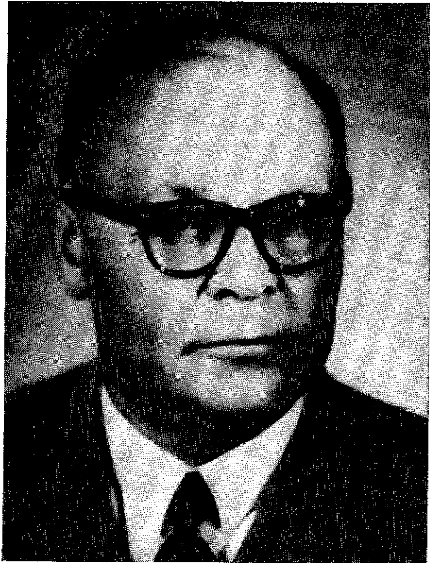
MERENKULKUNEUVOS ANTTI WIHURI