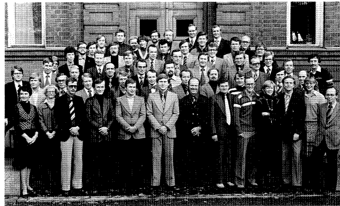
Johtamiskoulutusohjelman osanottajat lukuvuonna 1978—79. Eturivissä oikealla JOKOn henkilökuntaa.

Johtamiskoulutusohjelman suunnittelussa on kiinnitetty huomiota ohjelman soveltuvuuteen niin talouselämän kuin julkisen hallinnon kiinteisiin toimiville johtamistehtäviin valmistuville henkilöille. Ohjelman osanottajilta edellytetään koulutuksen omaksumisen edellyttämiä perustietoja sekä lyhyehkön käytännön kokemuksen kautta saavutettua johtamisen ongelmien tuntemusta. Koulutusohjelmaan sisältyi 500 opetustuntia ja se