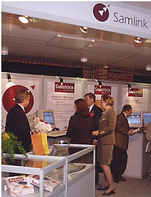
Samlink esitteli Sijoitus-Invest 96 -tapauksessa Windows-pohjaisia Samstock-monitoriohjelmiaan, jotka on tarkoitettu sijoitusalan asiantuntijoille, salkunhoitajille ja sijoitusrabasteille.