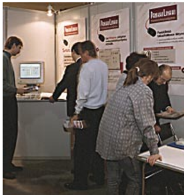
Windows-messuilla ja Toimistotekniikka KT 96 -messuilla Samlink esitteli yrityksille tarkoitettua Windows-pohjaisen monipankkiyhteisöohjelman, Pankkilinkin.