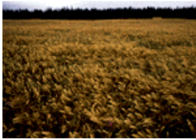
Pohjois-Amerikka on tärkeä kauran vientimarkkina.

Viljojen korkeat hinnat toivat satokauden aikana lisää maata viljelykseen eri puolilla maailmaa. Kun kasvuolot olivat yleisesti ottaen suosiolliset ja ennätysmääriä saatiin esimerkiksi Australian ja Argentiinan vehnävainioilta, viljojen hinnat kääntyivät selkeään laskuun. Kevätpuolella hinnat taas vakintuivat ja vahvistuivat uuteen satoon liittyvien epävarmuustekijöiden ja odotettavissa olevien pienten loppuvarastojen vuoksi. Öljysiementen hinnat pysyttelivät sen sijaan korkealla läpi koko satovuoden, kunnes kokivat huomattavan laskun satokauden lopulla.