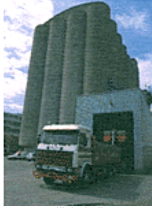
Rekkakuljetukset ovat tavallisin kuljetusmuoto Suomen sisällä tapahtuvassa viljakaupassa.

Yhtiön henkilöstön määrä oli tilikauden lopulla 86. Liikevaihto oli 96 miljoonaa markkaa.