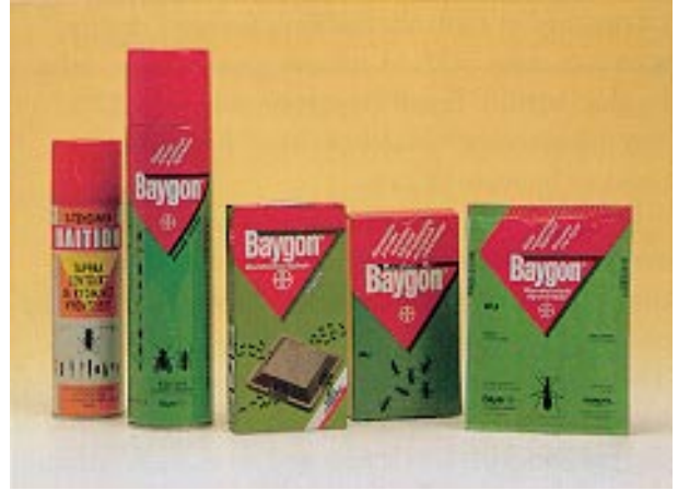
Baygon – ratkaisu kaikkiin kotitalouden hyönteisongelmiin.

Osaston myynti sekä tulos kehittivät suotuisasti.