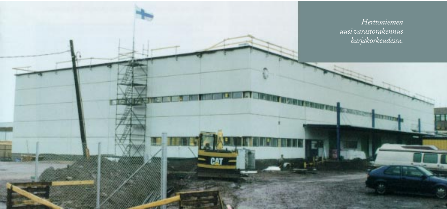
Herttoniemen uusi varastorakennus hajakorkeudessa.

Konsernin omavaraisuusaste nousi 64,4%:iin ja sijoitetun pääoman tuotoksi muodostui 15,7%.