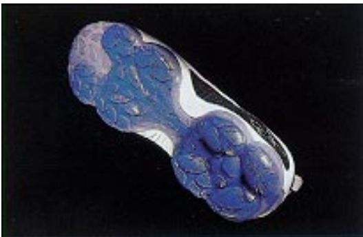
DMX 10-ulkopohja muodostuu kahdesta viiden ilmatyynyn yksiköstä, joiden välillä liikkuva ilma toimii sekä kengän iskunvaimentimena että tukielementteinä.