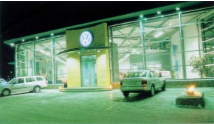
Kouvolan uusien autojen myymälä iltavalaistuksessa.

Suotuisan kehityksen uskotaan jatkuvan. Inflaatio pysyy alhaisena vaikkakin nousupaineita ylikuumentuneessa taloudessa on havaittavissa. Sekä yksityinen että julkinen kulutus kasvaa edelleen ja kun vielä työttömyys näyttää kääntyneen kestäväan laskuun, näyttää vahvalle kulutuskysynnälle olevan hyvät perusteet vuonna 1998.