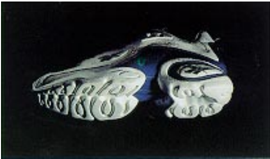
3 D Ultralite-kenkä on "ultra" kevyt ja joustava. Sillä saa erinomaisen tuntuman harjoitusalueeltaan ja sen iskunvaimennus on tavallista tehokkaampi.

Reebok esitteli kaksi uutta iskunvaimennusteknologiaa; DMX 10 ja 3 D Ultralite.