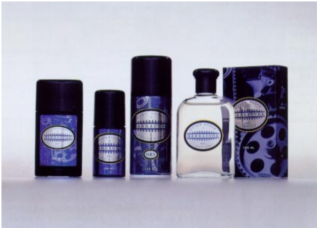
Uudistunut Barracuda-miesten sarja.