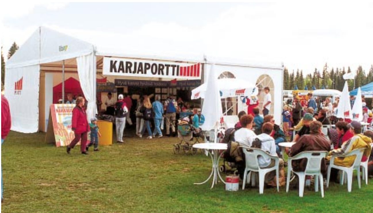
Karjaportin osasto Järvi-Suomen maaseutuäyttelyssä

Lokakuussa järjestettiin lihantuottajille perinteinen laivaristeily ja -seminaari, jossa käsiteltiin EU:n maatalouspolitiikan nykyvaihetta ja ajankohtaisia asioita eläinjalostuksesta. Marraskuussa vietettiin viidellä eri paikkakunnalla jäsenten tuottajajailtamia, joihin osallistui kaikkiaan lähes 3000 lihantuottajaa.