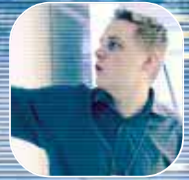
Tuotekehitys ja henkilöstö