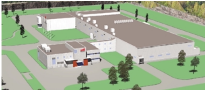
Karjaportin uusi ruokatehdas valmistuu Mikkeliin kevään 2003 aikana.