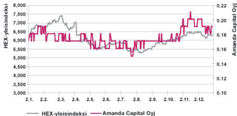
Osakkeen vaihto ja keskipurssi 2.1.2004 - 30.12.2004