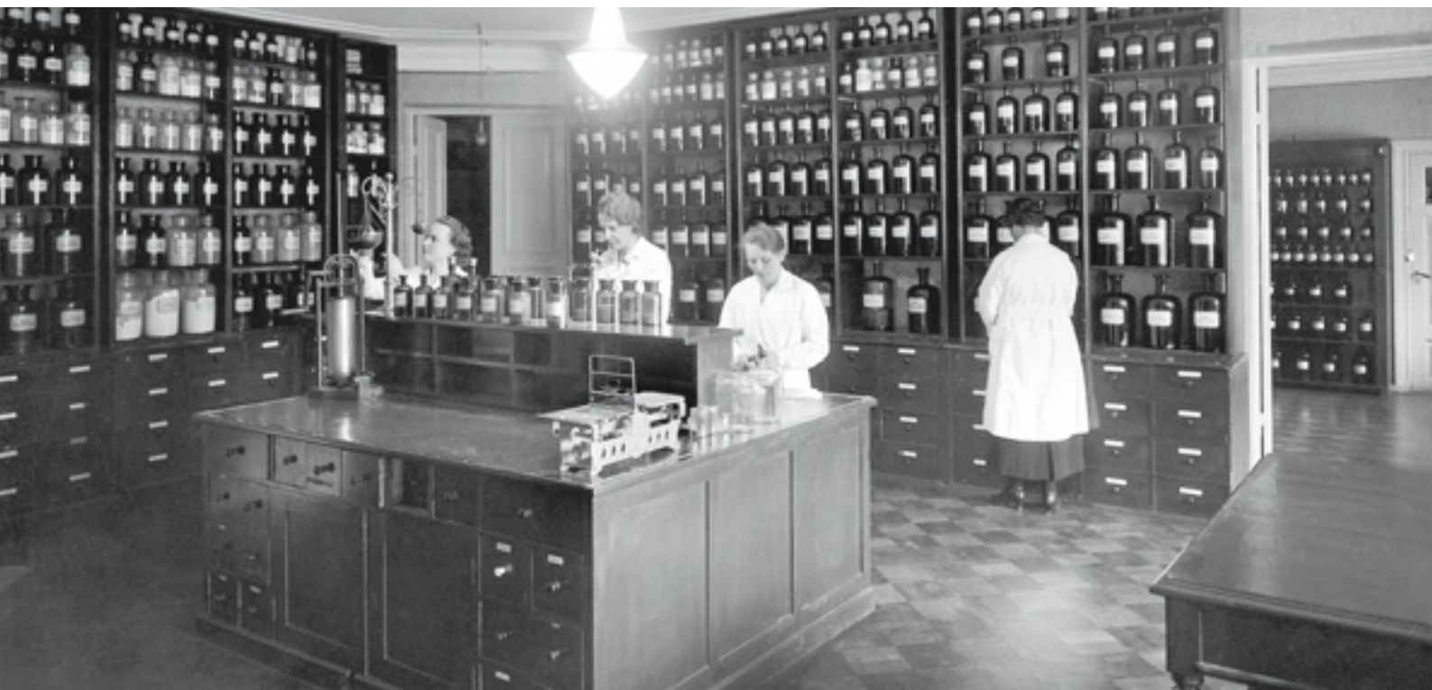
Apteekin laboratorio. Kuva on oletettavasti Aleksanterinkadun ja Itäisen Heikinkadun (Mannerheimintien) kulmatalosta, johon apteekki muutti 1928.