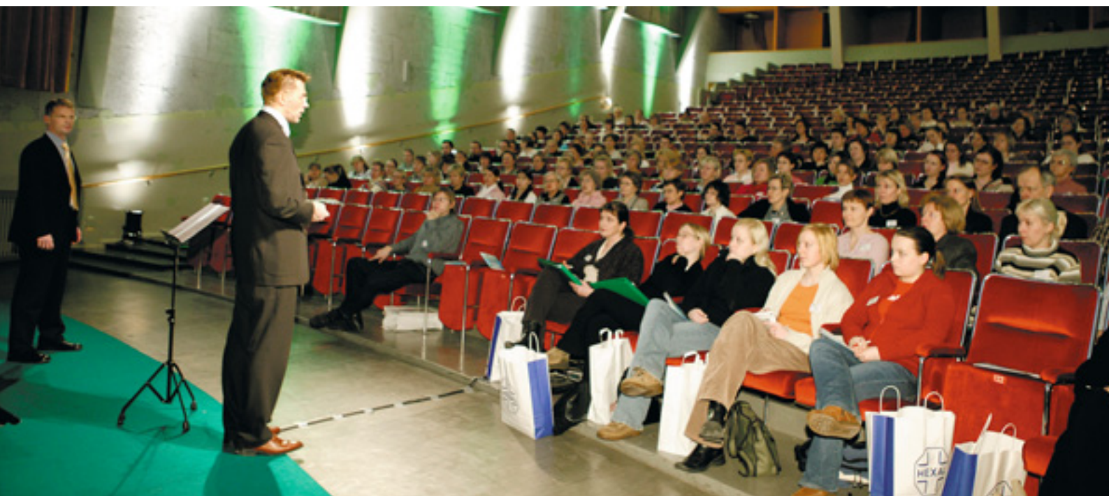
Yliopiston Apteekin juhlavuosi alkoi koko henkilökunnalle kolmessa osassa järjestetyillä Akatemiapäivillä.