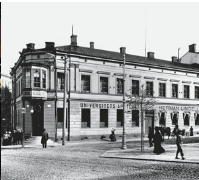
Yliopiston apteekki sijaitti v. 1900-1928 Aleksanterinkadun ja Itäisen Heikinkadun (Mannerheimintie) kulmatalossa. Keisarillinen kaksoiskotka on vaihtunut yliopiston lyyraksi.