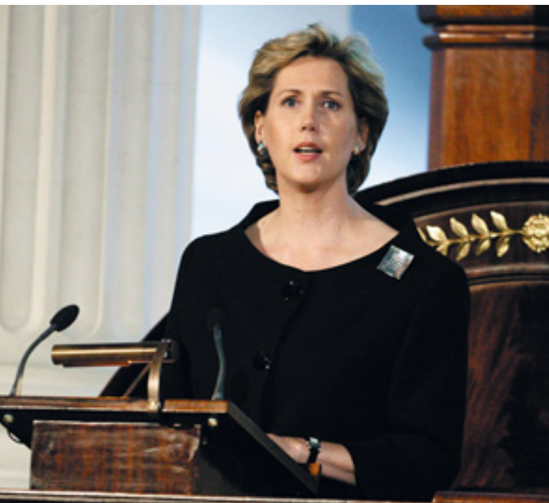
Sosiaali- ja terveysministeri Tuula Haatainen esitti Yliopiston Apteekki 250 vuotta -juhlassa valtiovallan tervehdyksen.