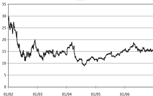
Nokian osakkeen kurssi Helsingin pörssissä EUR